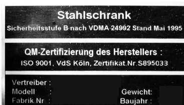
Beispiel Typenschild VDMA-Tresore